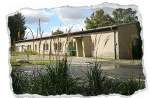
Judohalle des HS Greifswald Karl-Liebnecht-Ring 26 17491 Greifswald